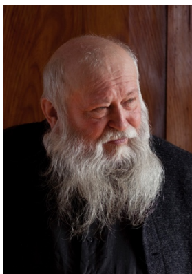
Hermann Nitsch Portrait